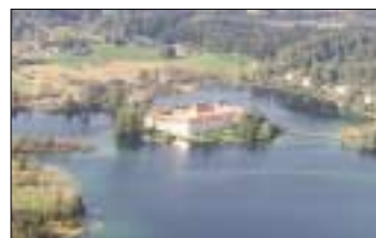
Umbau Kloster Seeon zum Oberbayerischen Bildungszentrum, Bauherr: Bezirk Oberbayern, Gebäudeplanung: Meixner, München, Tragwerksplanung Haumann & Fuchs.

und testen. Jedes zu planende Bauwerk ist für sich einzigartig« umschreibt Ludwig Haumann die größte Herausforderung im Planungsprozess. »Außerdem müssen wir uns aktuell mit der Umstellung nahezu aller Baunormen im Zuge der angestrebten europäischen Harmonisierung, seien es Lastannahmen, Massivbau, Holzbau oder Wärmeschutz -