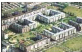
Wohnanlage »Weiße Taube«, 880 Wohnungen mit Tiefgaragen in Berlin-Hohenschönhausen, Bauherr: Regierungsbaumeister Max Aicher, Entwurf: Seifert Planung, Darmstadt + Weber, Klippel, Schulz, Berlin, Werk- und Tragwerksplanung: Haumann & Fuchs.

beit mit diesen Firmen zeigt, dass sie mit unserem Büro zufrieden sind«, so Ludwig Haumann.