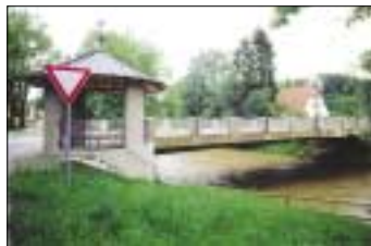
Haferlbrücke Traunstein, Bauherr: Stadt Traunstein, Entwurf, Statik, Ausführungsplanung und Abnahmen: Haumann & Fuchs.

Ein weiteres Standbein wurde mit einer Zweigniederlassung in Waldkraiburg geschaffen, um im Gebiet Waldkraiburg-Mühldorf-Altötting mehr präsent zu sein. Mit einer Beteiligung an der SAK Ingenieurgesellschaft mbH in Traunstein erstrecken sich die Leistungsangebote für Bauherrn auf weitere Felder wie Vermessung, Bauleitplanung und Ortsgestaltung, Deponiebau, Straßen- und Kanal-