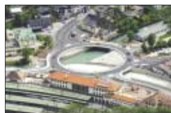
Kreisverkehr Berchtesgaden, Neubau der Brücken über die Ramsauer Ache, Königsseer Ache und die Berchtesgadener Ache mit Umbau des Straßenknotens, Bauherr: Staatliches Bauamt Traunstein, Tragwerksplanung: Hölige+Wind, Aufham, Prüfung der statisch-konstruktiven Unterlagen, Prüflingenieur Dr.-Ing. Walthari P. Fuchs.

»Wir stellen kein Serienprodukt her und können es nicht - wie z. B. in der Autoindustrie üblich - über Jahre entwickeln