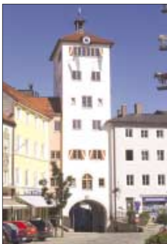
Jacklturm Traunstein, Bauherr: Förderverein Alt-Traunstein, Entwurf: Stadtbaumeister a. D. Simhofer, Tragwerksplanung: Haumann & Fuchs.

Zu einem »Tag der offenen Tür« lädt die Ingenieur-Gesellschaft Haumann und Fuchs am 15. Juni 2007 von 9.00 bis 16.30 Uhr in Traunstein-Haslach, Sonntagshornstr. 4, ein.