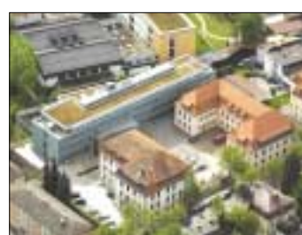
Neubau Finanzamt Traunstein, Bauherr: Freistaat Bayern, Gebäudeplanung: Staatliches Hochbauamt Traunstein, Tragwerksplanung: Haumann & Fuchs.