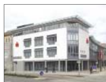
Hauptverwaltung Kreissparkasse Traunstein-Trostberg, Gebäudeplanung: Zeller+Romstätter, Traunstein, Tragwerksplanung: Haumann & Fuchs.

Wir gratulieren zum 30-jährigen Bestehen und freuen uns auf weitere Zusammenarbeit!