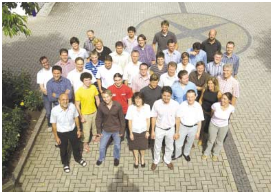
Für Bauprojekte aller Art steht ein leistungsfähiges, hoch motiviertes Team aus Architekten, Ingenieuren, Technikern, hoch qualifizierten Zeichnern und erfahrener Teamassistenz zur Verfügung.

Zu einem »Tag der offenen Tür« lädt die Ingenieur-Gesellschaft Haumann und Fuchs am 15. Juni 2007 von 9.00 bis 16.30 Uhr in Traunstein-Haslach, Sonntagshornstr. 4, ein.